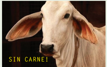
C10 MASAMADRE sin carne breakfast lunch & diner orgánicamente pllevar 4554 4555 luma:9 a 18 masa:9 a 24hs Olleroy y Fraga