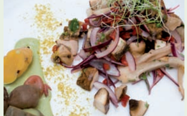
47 KENSHO RESTAURANTE cocina orgánica organic food 1/2 día: ma:do:12 a 16hs noche: masa: 20 a 0° am 47 78 06 55 El Salvador 5783 B3