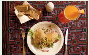
16 EL RINCÓN ORGÁNICO bio bar & delivery fresh & healthy gourmet organic food lusa:10 a 20hs 47 77 50 82 Gurruchaga 1001 E5