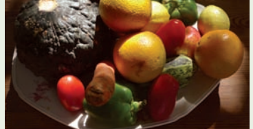
44 ARTEMISIA comida natural muy rica! gourmet natural masa noche 4863 4242 Cabrera 3877 F4 masa:9 a cierre do:9 a 17hs 4776 5484 Gorniti 5996 B4