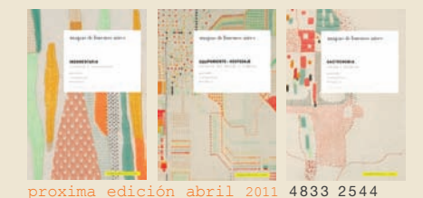
proxima edición abril 2011 4833 2544

eating oct - may 2011 drinking www.mapasbsas.com