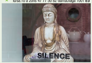
17 KENSHO deli & boutique organic shop & boutique ma:do:9 a 19hs 47 78 06 55 El Salvador 5777 B3